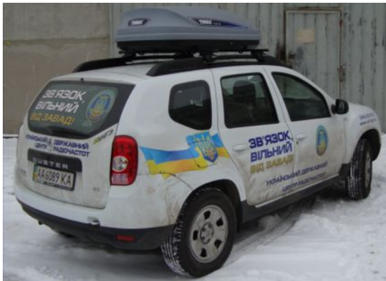
Мобильный радиопеленгатор «Беркут» на базе джипа Reno «Duster»: внешний вид