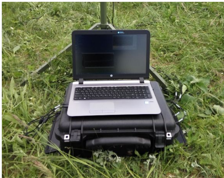
Внешний вид изделия «Панорама-Ф»

Результаты обнаружения заносятся в базу данных, которую можно редактировать, сортировать, выводить на печать.