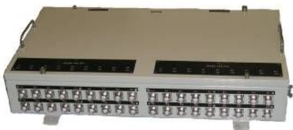
Внешний вид рамочных антенных элементов пеленгаторной АФС изделия “Восток-РП” (II поддиапазон частот)