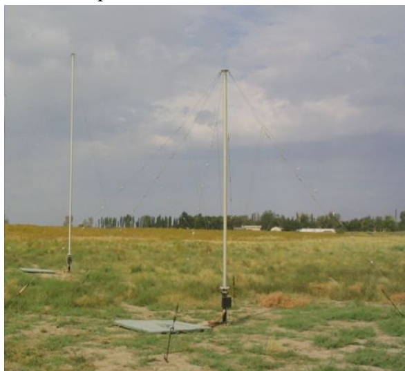
Внешний вид рамочных антенных элементов пеленгаторной АФС изделия “Восток-РП” (I поддиапазон частот)