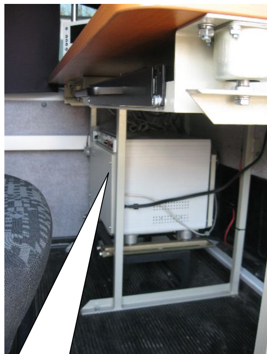
Блок VHF-UHF обнаружителя-пеленгатора