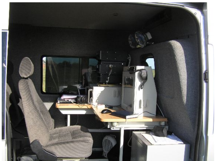
Рабочее место оператора станции «Барвинок-М»