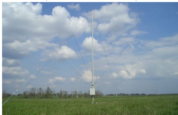
Внешний вид рамочных антенных элементов пеленгаторной АФС изделия “Восток-РП” (II поддиапазон частот)